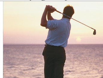
nebo si tu zahrát golf ...