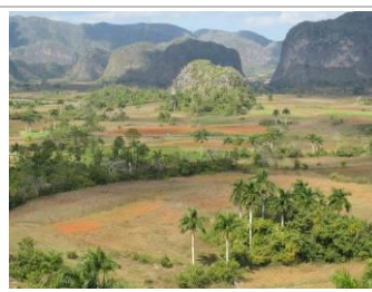
malebné údolí Viñales ,