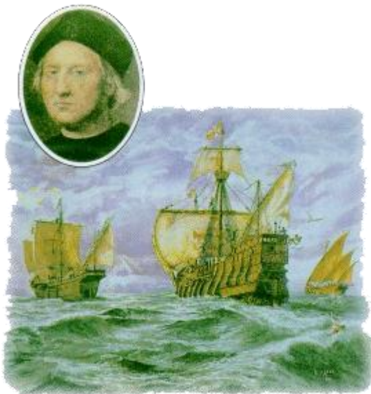
Kryštof Kolumbus, říjen 1492, Kuba

„Nejkrásnější místo, jaké jsem kdy spatřil“