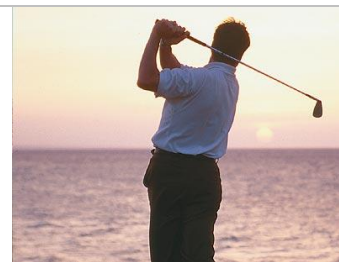
nebo si tu zahrát golf ...