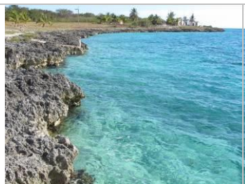
navštívit Žátoku Sviní ,

Kuba samozřejmě není jen o potápění. Kdo bude mít chuť a čas, může po skončení potápěčského programu ještě třeba