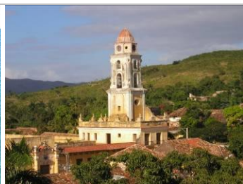
koloniální Trinidad ,